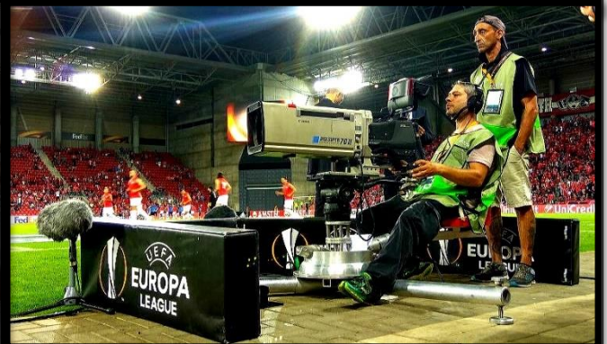
ליגה אירופית: הפועל באר שבע נגד אינטר מילאנו