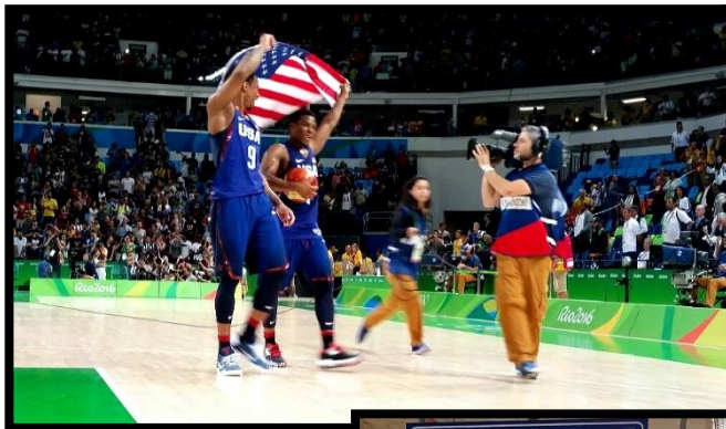
אולימפיאדה- ריו, 2016