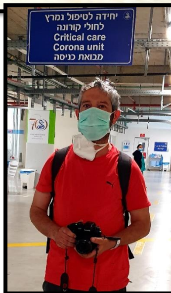
שיבא תל השומר