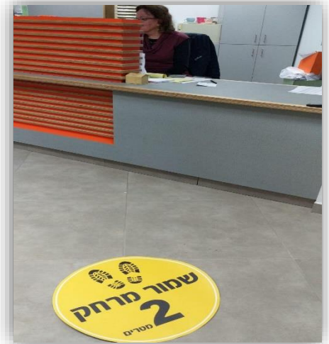
-שמור מרחק 2 מטרים-